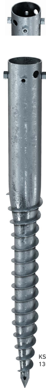
KSFG 114x 1300-4xM16