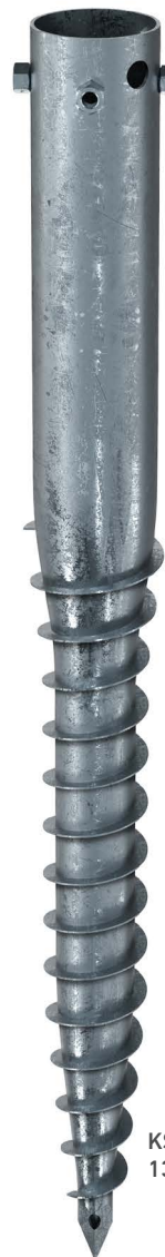
KSFG 114x 1300-4xM16