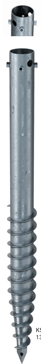
KSFG 89x 1300-4xM12