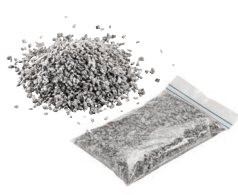
Spezialgranulat 0,50 kg Art.-Nr. 21823