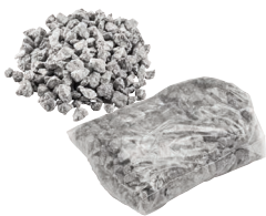
Spezialgranulat 1,50 kg Art.-Nr. 21824