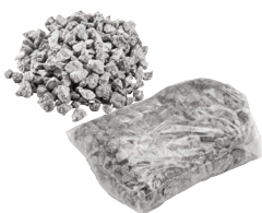
Spezialgranulat 1,50 kg Art.-Nr. 21824