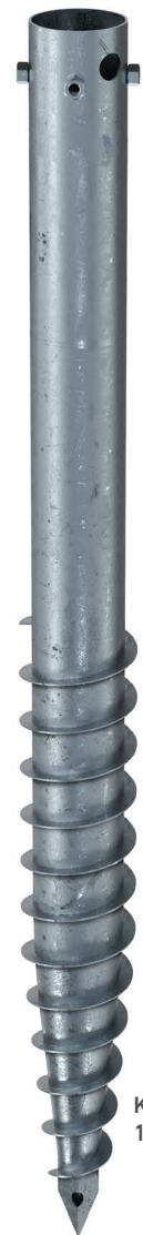
KSFG 89x 1300-4xM12