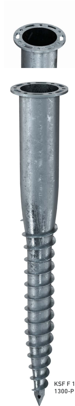
KSF F 140x 1300-P