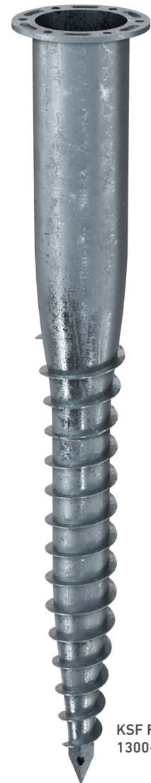
KSF F 140x 1300-P