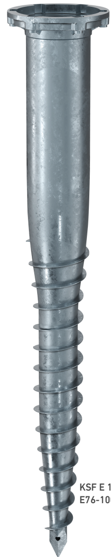
KSF E 140x1300-E76-100