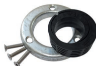
Exzentrersatz-E60 Art.-Nr. 24817