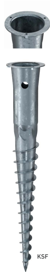
KSF E 89x800-E60